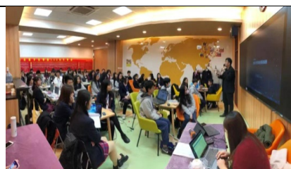
模擬商業經營競賽