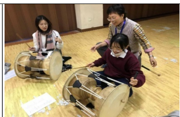
韓國學校支援選修課程