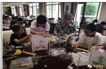
社區中秋聯歡活動