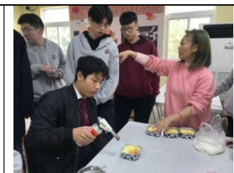
家長支援烘焙課程