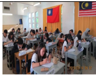
赴馬來西亞臺校短期交流