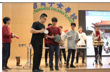
朱宗慶打擊樂講座