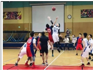
與新加坡學校友誼賽