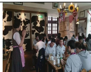
家長支援德語課程